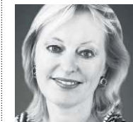
Jet Bussemaker (PvdA) is minister van Onderwijs, Cultuur en Wetenschap.

Het sociaal leenstelsel leidt tot een hogere studieschuld, maar wie niet kan terugbetalen hoeft niet terug te betalen