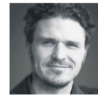
Dave Eggers is een Amerikaanse schrijver. Onlangs verscheen van hem De Cirkel , een roman over een sociaal medium dat privacy in de ban doet. © The Guardian. Dit is een ingekorte versie.

schrijvers die van communistische sympathieën worden verdacht. Prince stemt toe en trekt daardoor de aandacht van de autoriteiten.