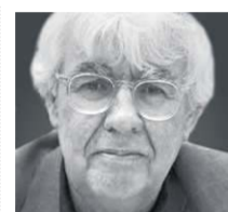
Geert Mak is schrijver. Dit artikel is een bewerking van de toespraak die hij hield voor 'Europa 14/14', een project van de Berlijnse History Campus, met het Gorki Theater en de Bundeszentrale für politische Bildung.