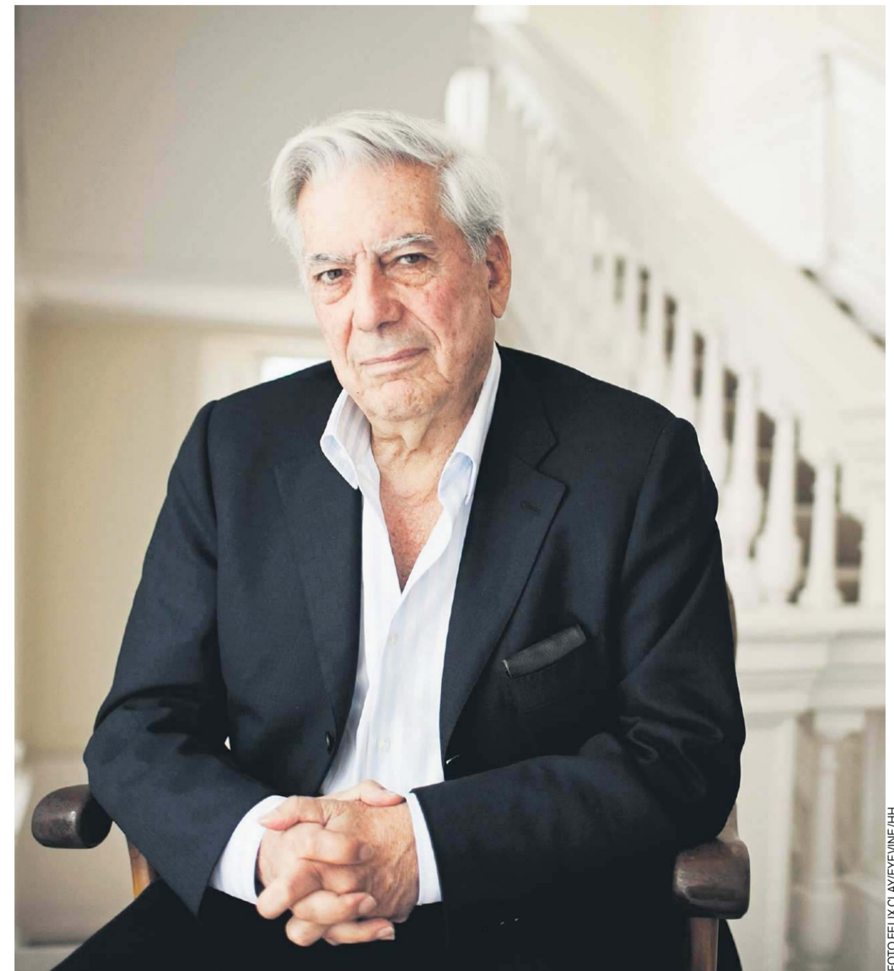
Mario Vargas Llosa: 'Dit leven is toeval en daarna is alles voorbij? Dat is absurd'

„En Fonchito dan? We weten niet wat hij zal doen. Misschien vindt hij een uitweg. Wacht op mijn volgende boek.”